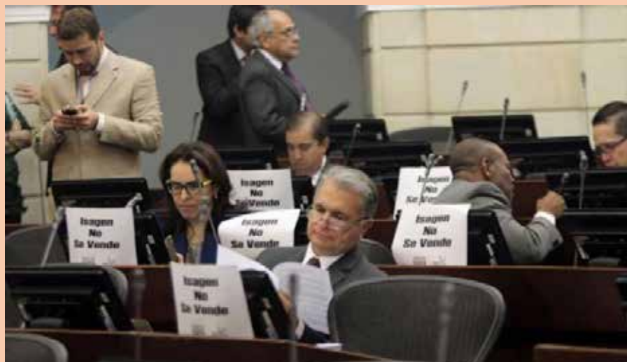
Al cierre de esta edición, se conoció que el Consejo de Estado negó el recurso de súplica interpuesto por el ministro de Hacienda, Mauricio Cárdenas.

puestas por Sintraisagen y Cedetrabajo las que unificó esa corporación para estudiar el tema y ya se advirtió que no se levantará la medida cautelar hasta que el tema sea definido de fondo por los consejeros. La empresa no podría tampoco, mientras hay una decisión, emitir acciones o bonos.