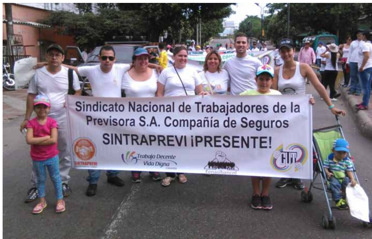
Sintraprevi en Medios